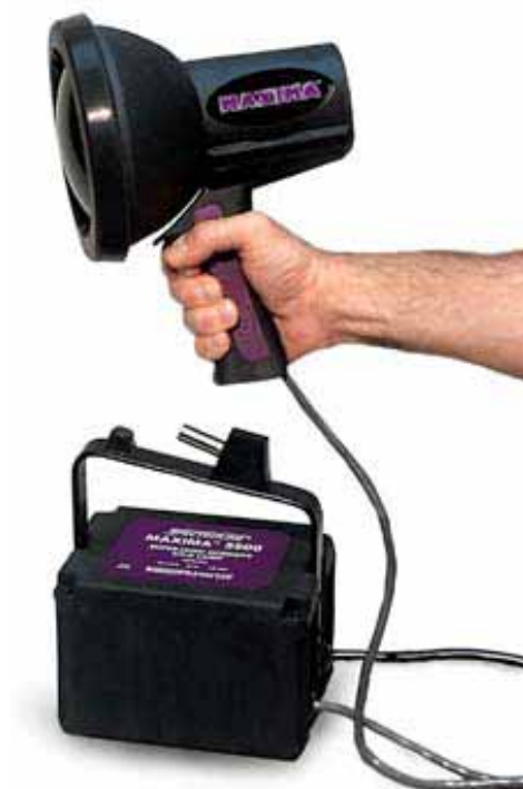
Projecteur secteur 230vac